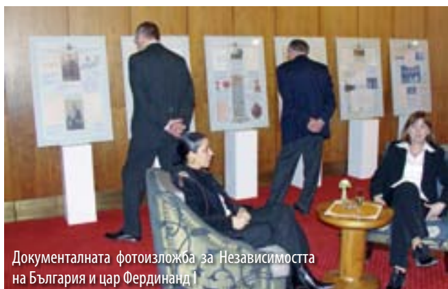
Документалната фотоизложба за Независимостта на България и цар Фердинанд I