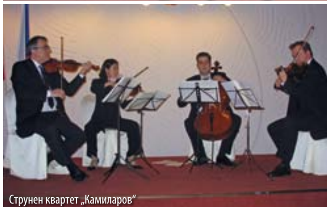
Струнен квартет „Камиларов“