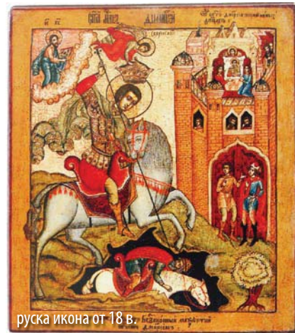
руска икона от 18 в.

се откаже от вярата си. Увещанията били напразни и затова го хвърлили в тъмница. По това време в цирка устройли тържества, на които Лий, прочут борец и любимец на императора, приканвал осъдените християни на борба и ги хвърлял в падина върху копия, забити с острието нагоре. Оръженосецът на Димитрий, Нестор, изпросил разрешение от господаря си да иде на борба – отишъл и захвърлил Лий в пропастта. Затуй, по нареждане на императора, Нестор бил обезглавен, а Димитрий – прободен с копие.