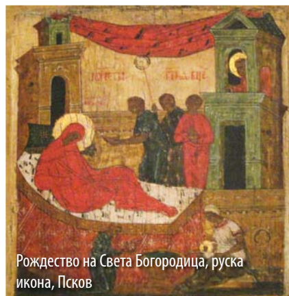
Рожество на Света Богородица, руска икона, Псков

Двамата били много щедри и милосърдни и тъй като нямали деца, ежедневно се молили на Бога за рожба. Веднъж, като работела в домашната си градина, Ана видяла сред клоните на едно лаврово дърво гнездо с малки птиченца. Гледката я хвърлила в още по-голяма скръб. „Само аз, Господи – каза тя със сълзи на очи, – съм мъртва и безжизнена. Цялата природа те прославя със своите плодове. Само аз съм бездетна като безводна пустиня. Ти си дарил на Сарра в старините ѝ син. Чуй и мене. И аз ще Ти принеса роденото от мене в дар, за да бъде благословено в него Твоето милосърдие!“ И ето – ангел Господен застанал пред нея и ѝ казал: „Ано, твоята молитва е чута. Ти ще родиш благословена дъщеря, заради която ще бъдат благословени всички земни родове. Чрез нея ще бъде дадено спасение на целия свят. Ще я наречеш Мария.“