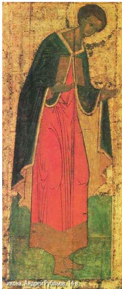
икона, Андрей Рубльов, 14 в.

На връщане от поход на Изток, император Максимилиан спрял в Солун и поискал от Димитрий да