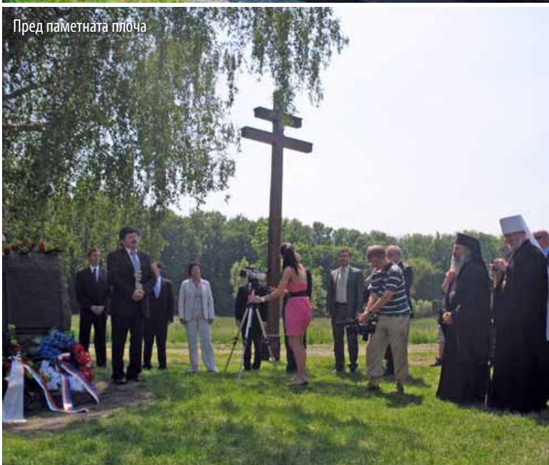
Пред паметната плоча