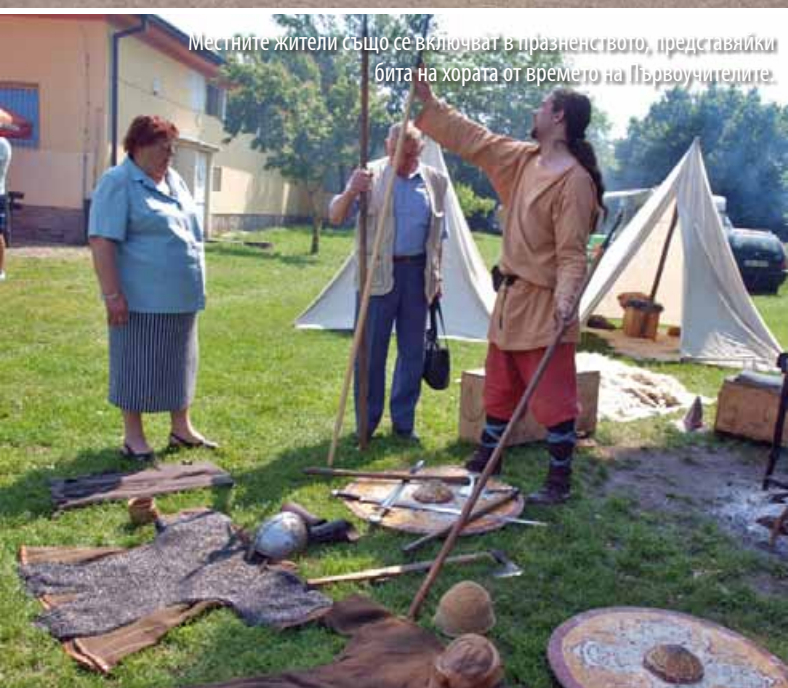
Местните жители също се включват в празненството, представяйки бита на хората от времето на Първоучителите.