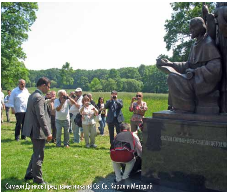
Симеон Дянков пред паметника на Св. Св. Кирил и Методий