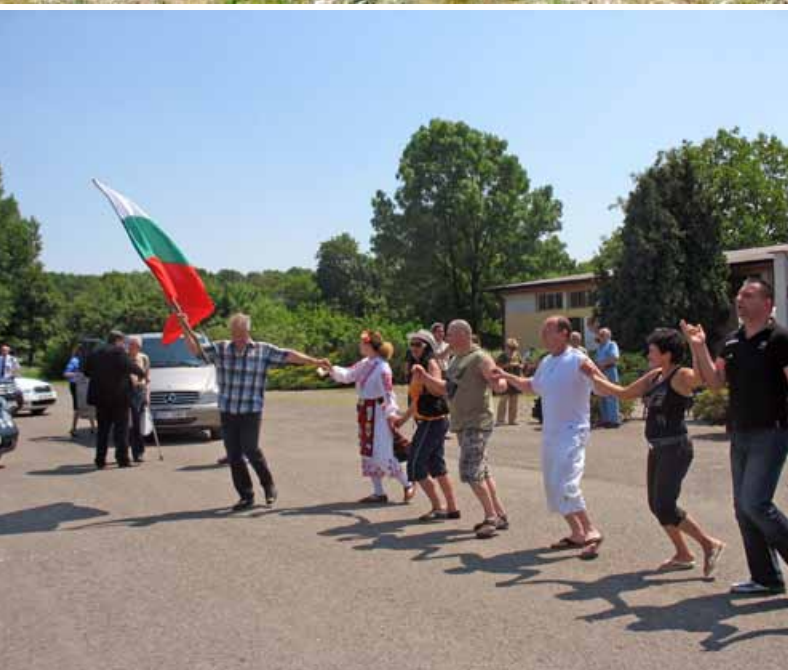
Танцов състав „Китка“ от Бърно