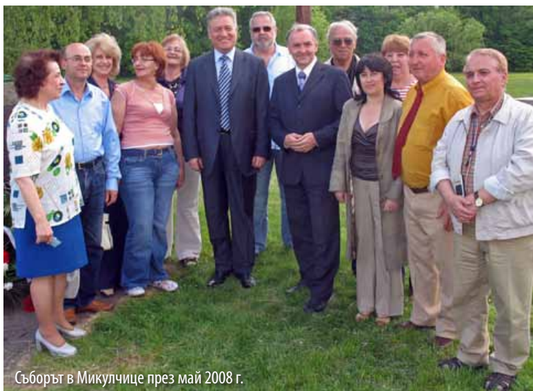
Съборът в Микулчице през май 2008 г.