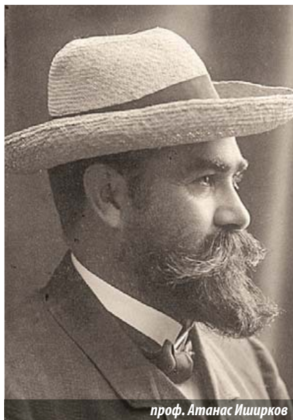
проф. Атанас Иширков