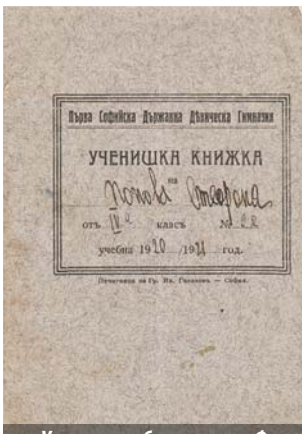
Ученически бележник на Фани