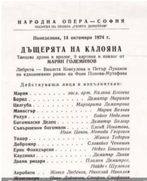
Покана за „Дъщерята на Калояна“