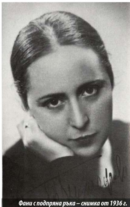
Фани с подпряна ръка – снимка от 1936 г.