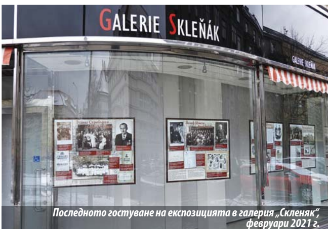
Последното гостуване на експозицията в галерия „Скленяк“, февруари 2021 г.

че Националната библиотека се посещава от много млади хора, които чрез тази експозиция имат възможност да обогатят познанията си с факти, които младото поколение и в Чехия, и в България не знаят.