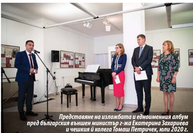
Представяне на изложбата и едноименния албум пред българския външен министър г-жа Екатерина Захариева и чешкия ѝ колега Томаш Петричек, юли 2020 г.