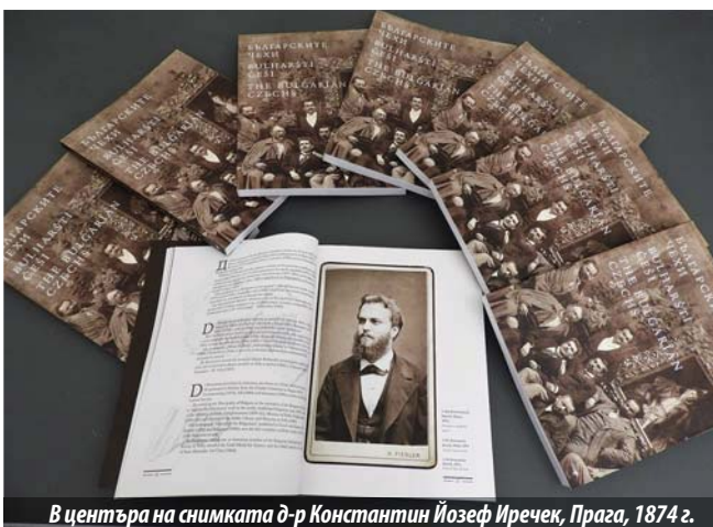
В центъра на снимката д-р Константин Йозеф Иречек, Прага, 1874 г.