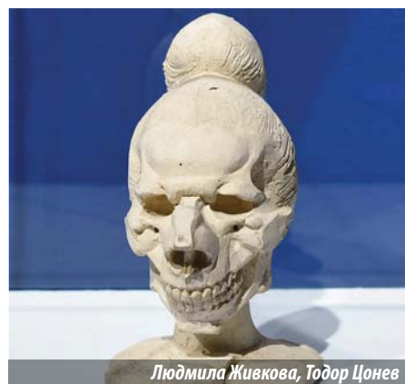
Людмила Живкова, Тодор Цонев