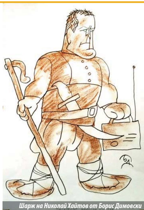
Шарж на Николай Хайтов от Борис Димовски