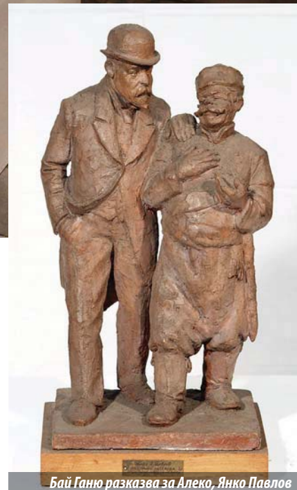
Бай Ганю разказва за Алеко, Янко Павлов

Възможно ли е да видите на едно място Чудомир, Алеко Константинов, Радой Ралин, Тодор Колев, Стоянка Мутафова, Велко Кънев и Татяна Лолова, подредени на разстояние метър и половина един от друг, според изискванията на протиепидемичните мерки? Изложбата „Портрети, автопортрети и шаржове“ от колекцията на Музея на хумора и сатирата в Габрово, която бе открита на 12 февруари при голям интерес от страна на публиката, е подредена така, че да предостави максимална безопасност на посетителите на Музея.