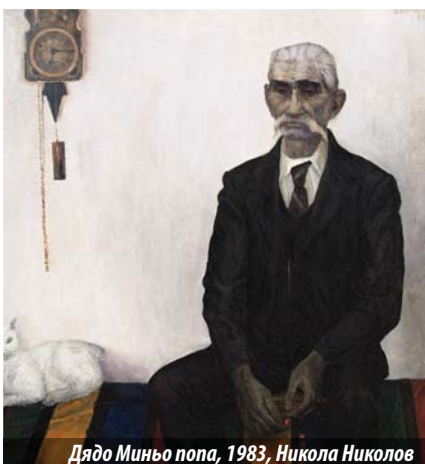
Дядо Миньо попа, 1983, Никола Николов