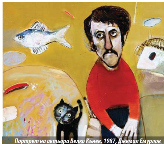
Портрет на актьора Велко Кънев, 1987, Джемал Емурлов