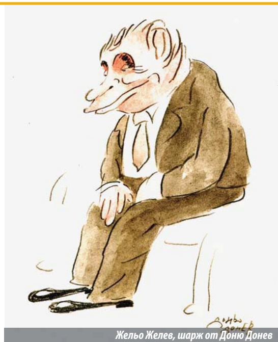
Жельо Желев, шарж от Доню Донеv