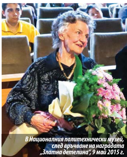
В Националния политехнически музей, след връчване на наградата „Златна детелина“, 9 май 2015 г.