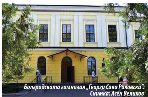
Болградската гимназия „Георги Сава Раковски“.

Идеята за създаване на българска гимназия в Бесарабия принадлежи на руския славист, българист, фолклорист, етнограф и филолог Юрий Венелин. През 1832 г. той предлага да се открие Централно училище и Национален български музей в Болград. Проектът за българско средно училище в Бесарабия е разглеждан от руската администрация и преди, но не получава развитие, заради политиката за създаване на централизирана