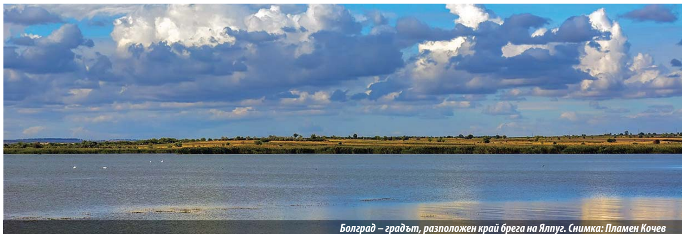
Болград – градът, разположен край брега на Ялпуг.

Д-р Иван Селимински, „Съчинения“, София, 1989 г., стр. 297