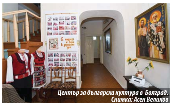
Център за българска култура в Болград.

образователна система. Осъществяването му обаче става възможно след Кримската война, когато Болград (с около 40 български колонии) е присъединен към Молдова. През януари 1858 г. делегация от българските колонии носи на княз Никола Конаки-Богориди подписка за откриване на училището. Самият той е от български произход, правнук на Софроний Врачански и син на Стефан Богориди. Откриването на първата българска гимназия е улеснено и от българския революционер Георги Раковски, който познава княза лично и пристига в Молдова, за да поиска от Богориди разрешение за откриване на българска печатница там. На 28 юни 1858 година княз Никола Богориди издава