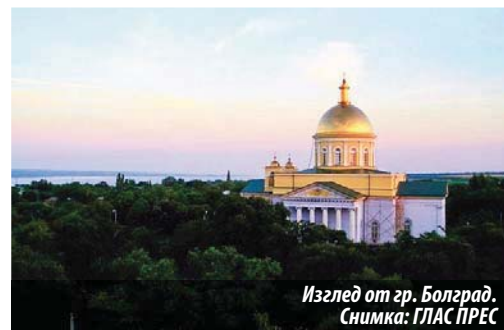
Изглед от гр. Болград.

Историята му е, може да се каже, най-романтичната, най-духовната, най-поучителната част от летописа на установяването на българите по земите на Бесарабия. Първото нещо, което правят преселниците, е да построят