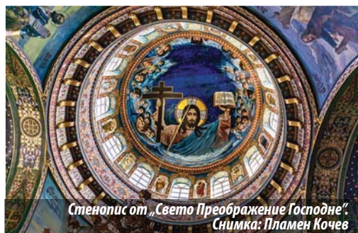
Стенопис от „Свето Преображение Господне“.

църква. Храмът, започнат през 1820 г. и наречен по-късно „Перлата на Бесарабия“, е построен от няколко вълни