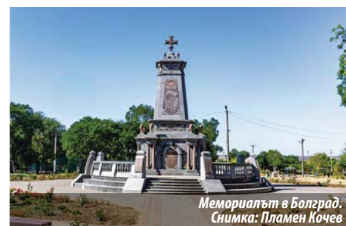
Мемориалът в Болград.

Посветен на българските опълченци от Бесарабия, участвали в Руско-турската война от 1877–1878 г. От четирите страни са разположени плочи с 225 имена на българи, сражавали се в Руско-турската освободителна война. ♦ (В материала е използвана информация и от: unimedia.shu.bg и eurochicago.com).