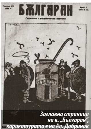
Заглавна страница на в. „Българан“, карикатурата е на Ал. Добринов