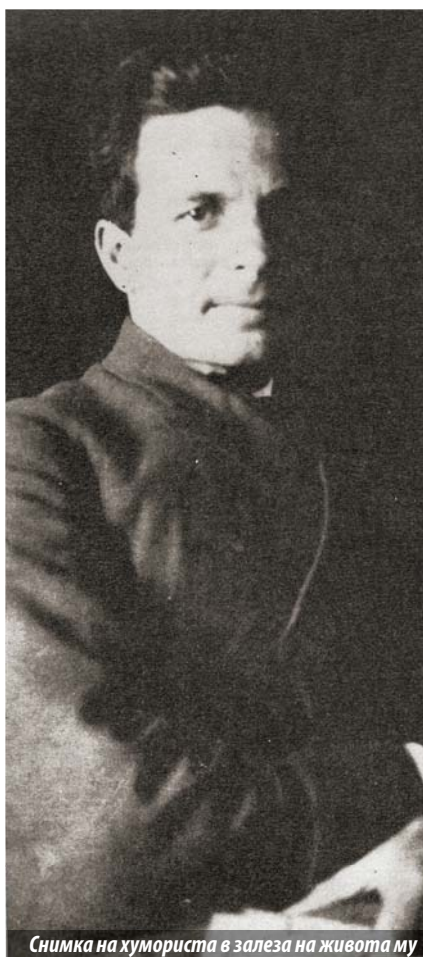
Снимка на хумориста в залеза на живота му

в света без никакви покани: не пели ангели в просторите, не били даже и камбани.