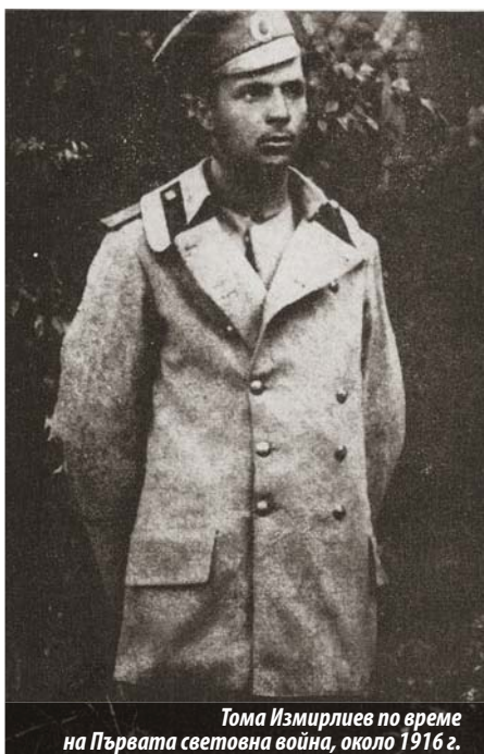
Тома Измирлиев по време на Първата световна война, около 1916 г.