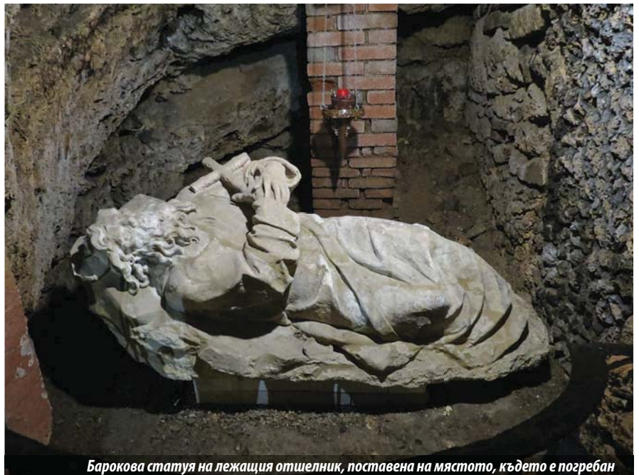
Барокова статуя на лежащия отшелник, поставена на мястото, където е погребан

Когато князът се завърнал в замъка си Тетин, разказал на жена си