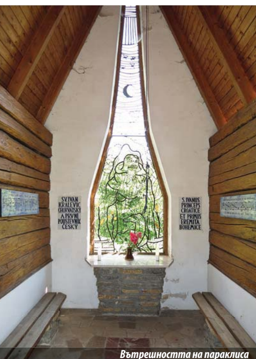
Вътрешността на параклиса

ланието му на това място в скалата, където преживял целия си отшелнически живот.