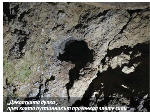
„Дяволската дупка“, през която пустинникът прогонвал злите сили