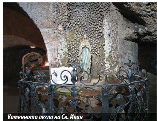
Каменното легло на Св. Иван