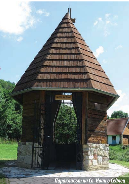
Параклистът на Св. Иван в Седлец