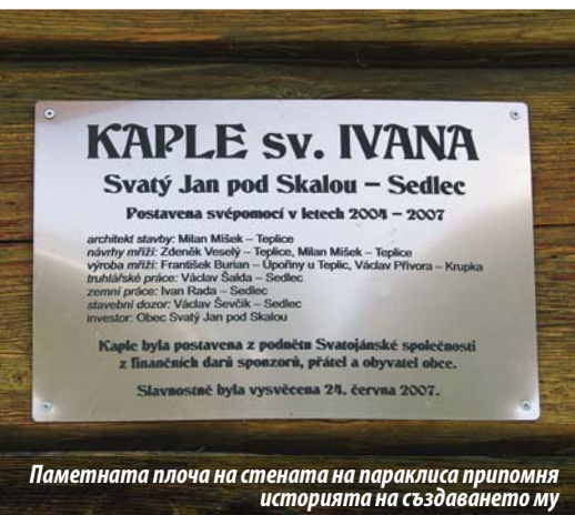
Паметната плоча на стената на параклиса припомня историята на създаването му