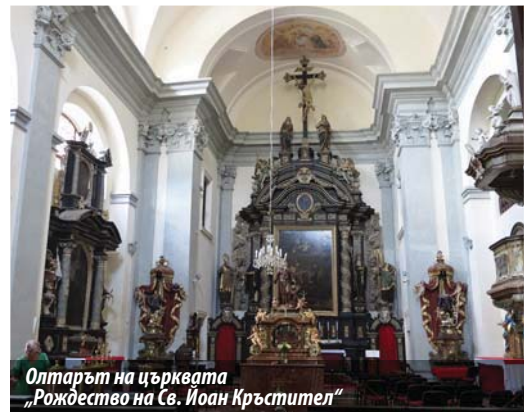
Олтартът на църквата „Рождество на Св. Йоан Кръстител“